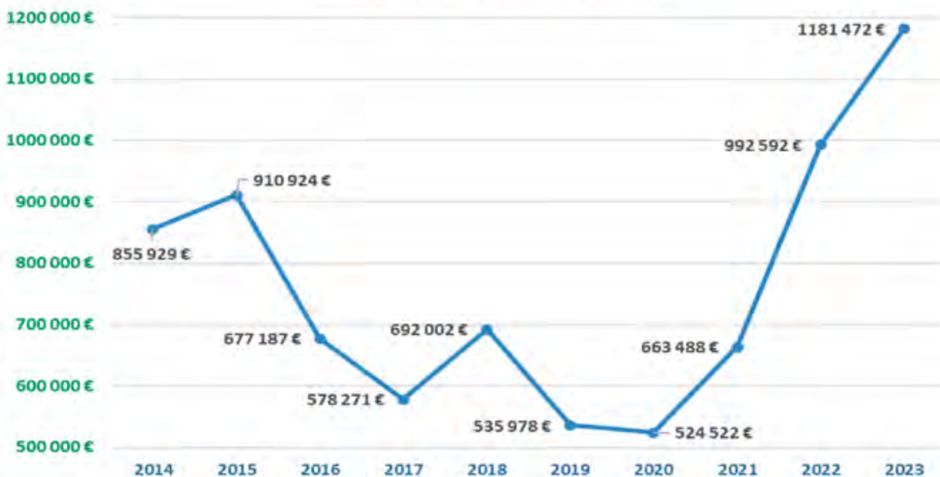
Excédent de fonctionnement

▶ L'excédent a été doublé entre 2019 et 2023.